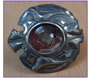
Reliekhouders met relik van Antonius Abt

Direct vanaf het begin tot aan het einde heerschte er een gezellige stemming onder de leden, en menig glaasje bier werd dan, onder de vroolijke tonen der muziek, geledigd, totdat het uur van scheiden kwam, en allen hoogst voldaan huiswaarts keerden.